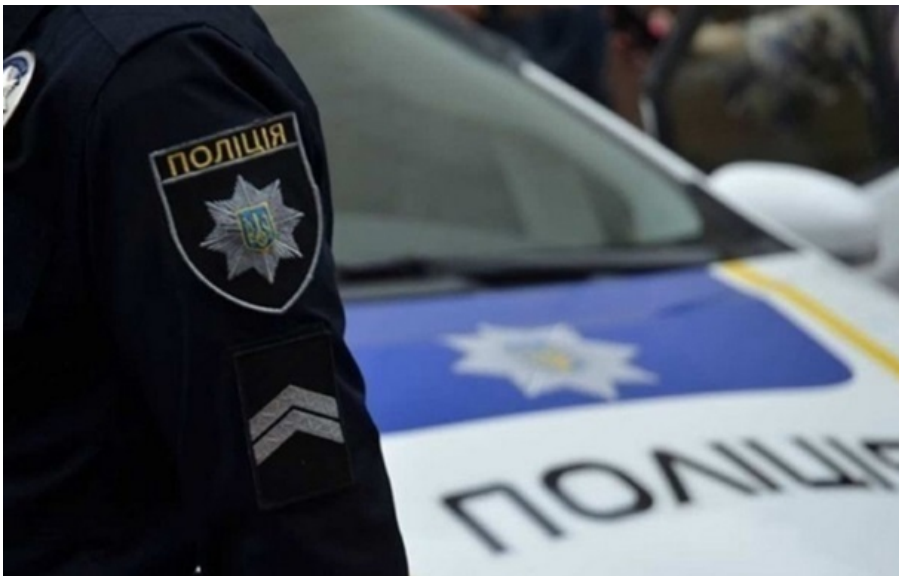
Фото: Національна поліція України (ілюстративне фото) Поліція на Великдень працюватиме у посиленому режимі

Поліція може проводити вибіркові перевірки для недопущення провокацій Україні та гарантування безпеки людей.