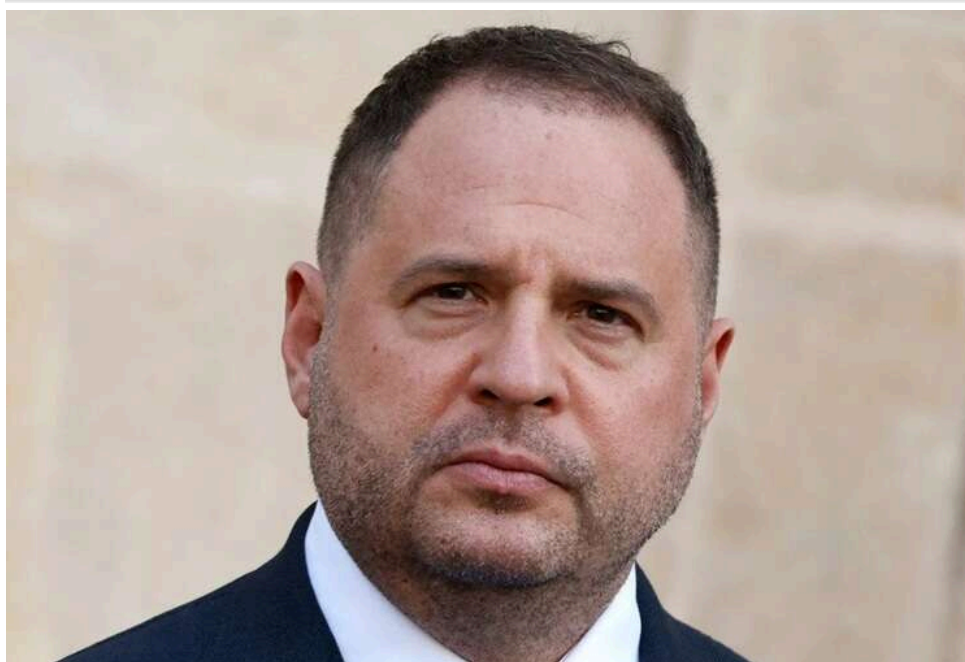
Справа «Династії»: експертці НАБУ погрожували, а СБУ збирала на неї дані через закриті бази, – нардепка Радіна

Експертці, яку НАБУ та САП залучили до роботи над експертизою щодо скандального будівництва "Династії" у справі Андрія Єрмака погрожували.