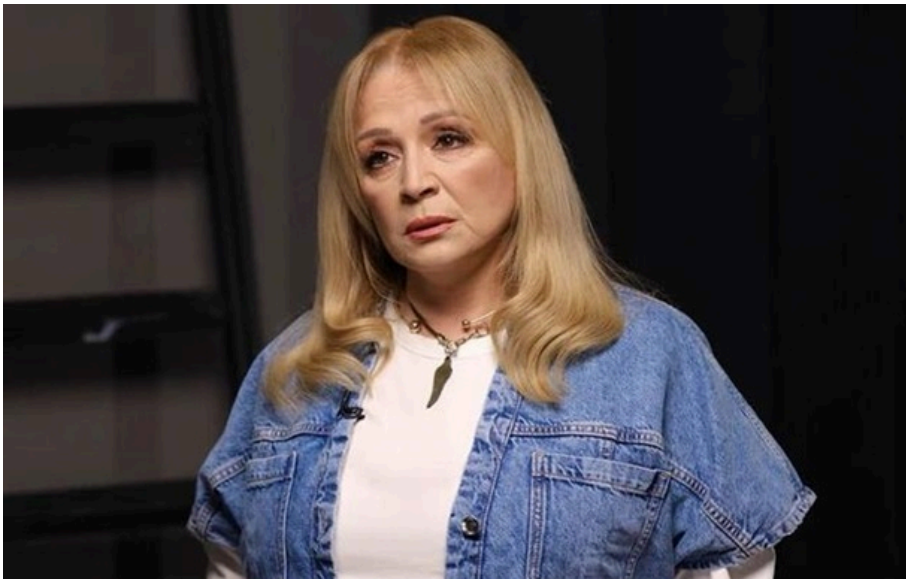
Фото: Скриншот Ауріка Ротару

Співачка додала, що завдяки додатковому джерелу доходу може почуватися впевненіше навіть у непростий для артистів час.