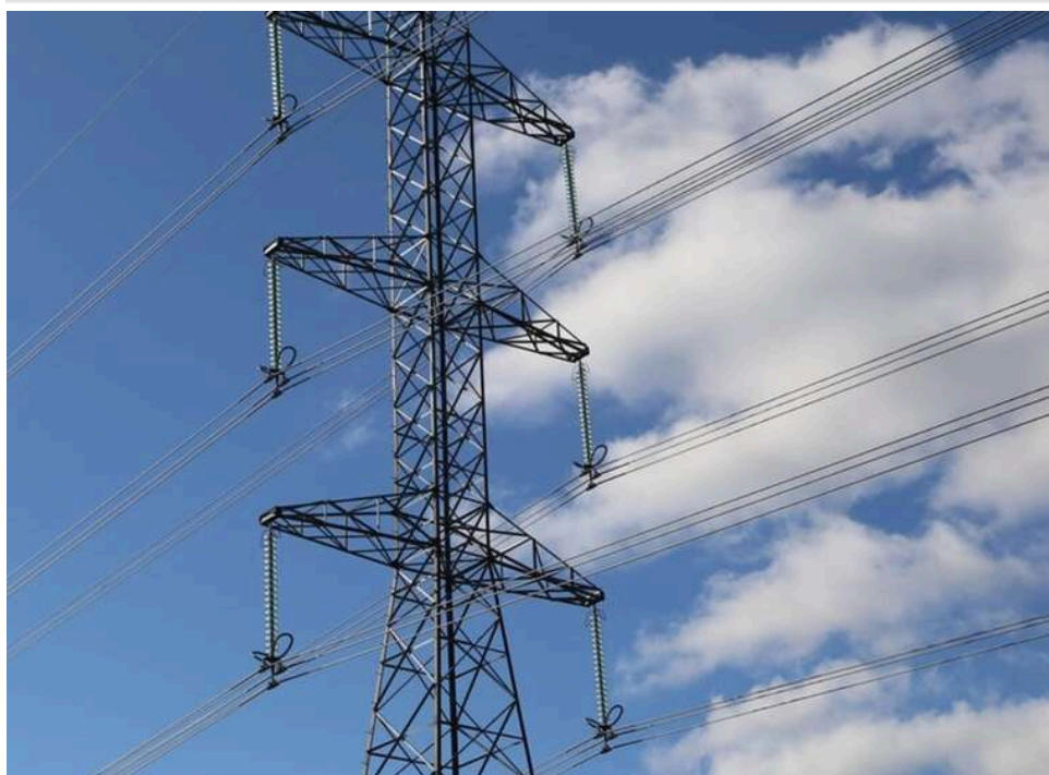
Тарифний популізм завершується: уряд готує новий механізм розрахунків за світло для водоканалів і ТКЕ

Тарифний популізм завершується. Прийшов час платити за воду, тепло та світло реальну ціну.