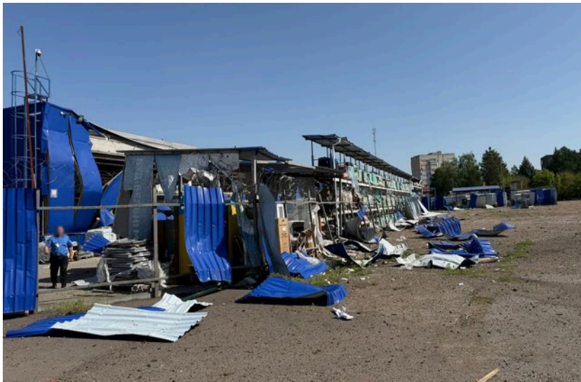
Фото: росіяни вдарили балістикою по центру Прилук