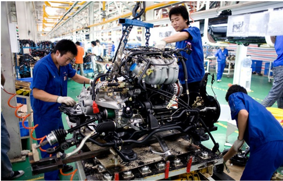
Фото: Getty Images (ілюстративне фото)

Працівники автогіганта BYD стали жертвами зловживань у трудових договорах