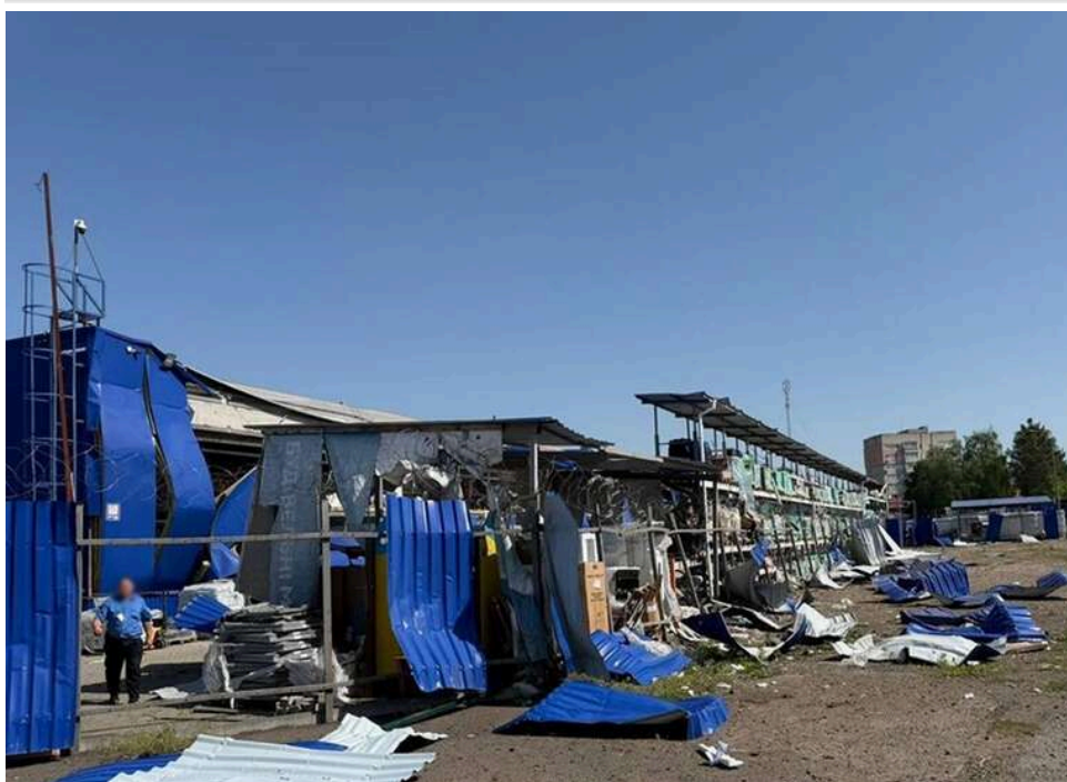
Ранковий терор півночі: через ворожі обстріли у Прилуках та Глухові загинули четверо людей

Четверо загинув на півночі України внаслідок ранкових обстрілів.