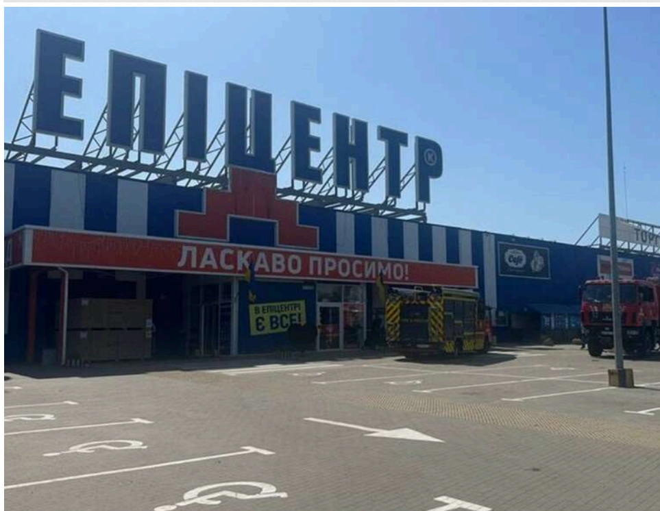
У Прилуках балістична ракета влучила в район гіпермаркету «Епіцентр»: є травмовані

19 травня російські війська балістичною ракетою вдарили по Прилуках на Чернігівщині. Внаслідок влучання сталося займання на даху будівельного гіпермаркету "Епіцентр".