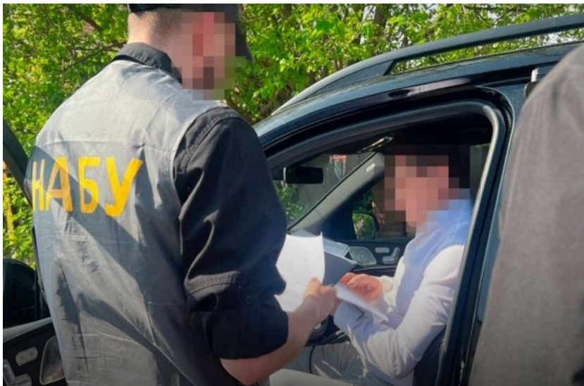
Фото: проведення обшуків (t.me/nab_ukraine)