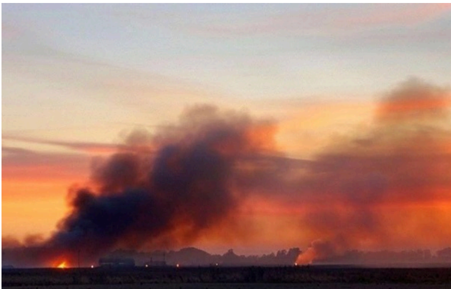
Пожежа на місці "прильотів" на Чернігівщині

Внаслідок влучань дронів на території виробничих об'єктів зафіксовано руйнування критично важливого обладнання.