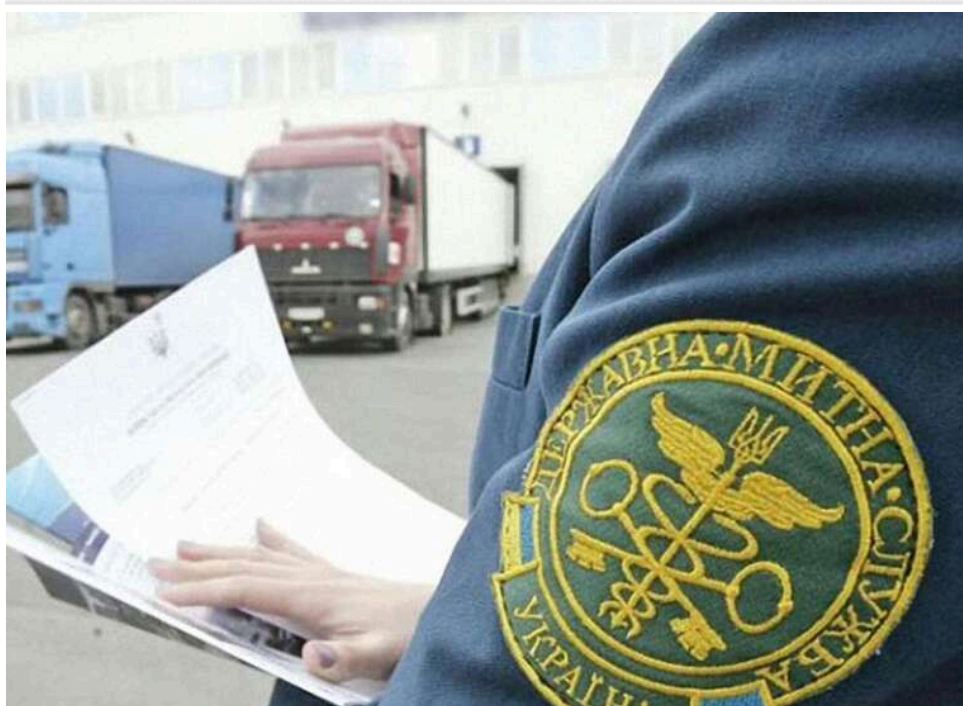
У Кам'янці-Подільському митників викрили на схемі «100 доларів за авто»: суд виніс вирок