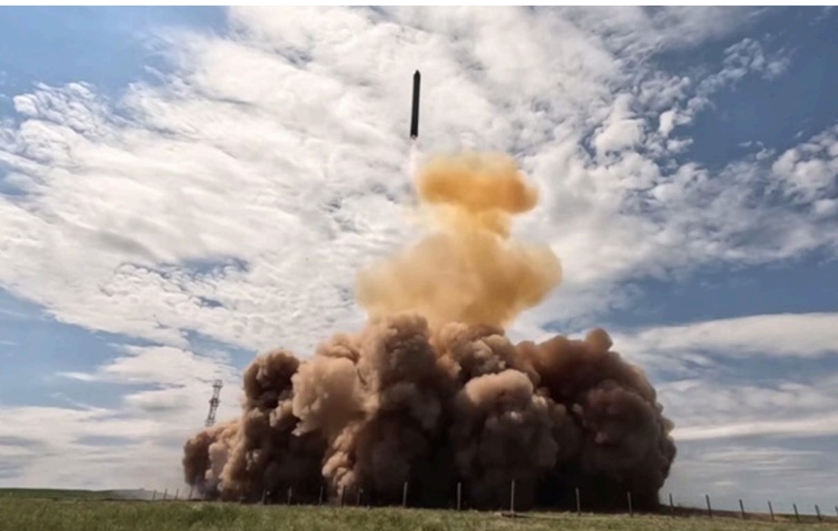
Фото: Скріншот Запуск російської міжконтинентальної балістичної ракети Сармат

Метою ядерних навчань є нібито відпрацювання дій для стримування противника та перевірка рівня підготовки залучених військ.