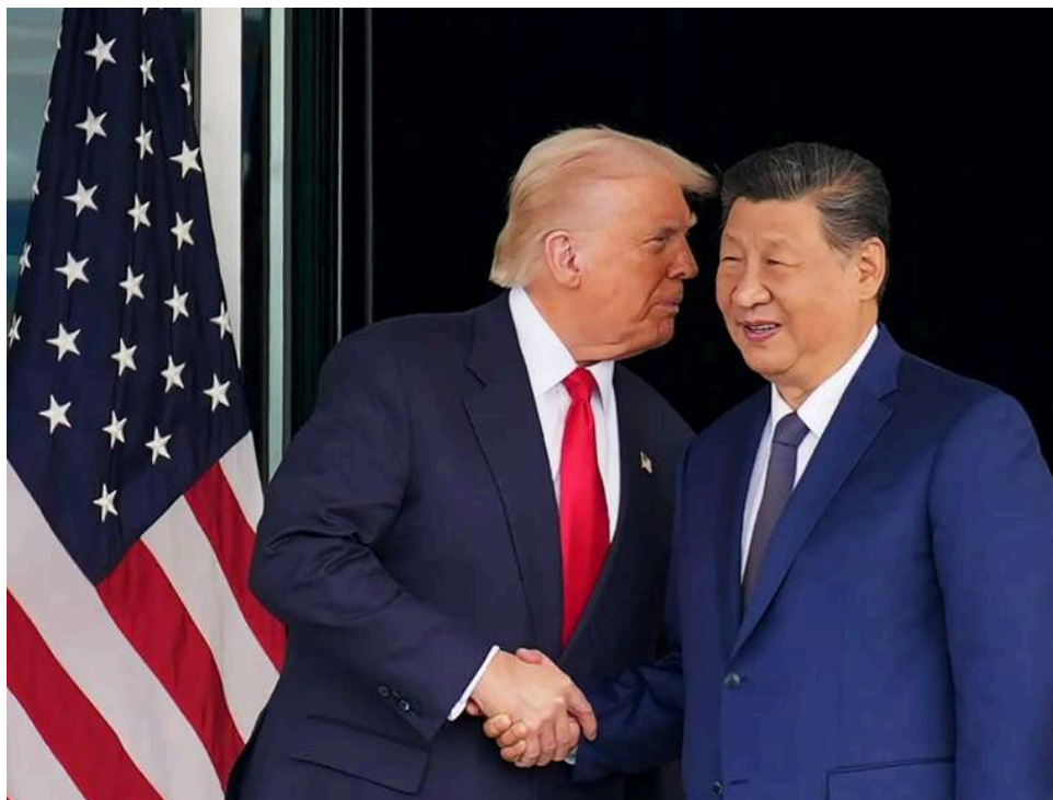
Financial Times: Сі Цзіньпін заявив Трампу, що Путін може пошкодувати про війну в Україні

Видання Financial Times з посиланням на джерела написало, що лідер Китаю Сі Цзіньпін під час переговорів з президентом Сполучених Штатів сказав Дональду Трампу, що правитель Росії Володимир Путін може зрештою пошкодувати про своє вторгнення в Україну.