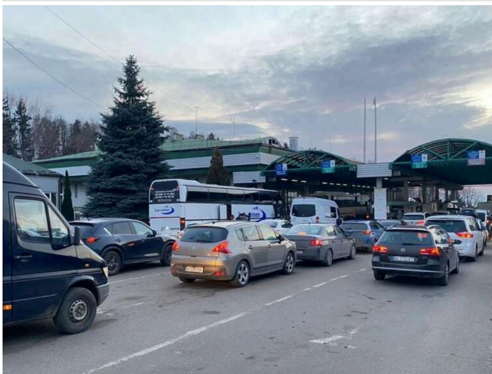
Україна планує запустити еЧергу для легкових авто на кордоні вже у червні

Міністерство розвитку громад та територій планує запустити електронну систему еЧерга для перетину кордону легковими автомобілями у червні цього року. Записатися можна буде через "Дію", сайт та мобільний додаток.