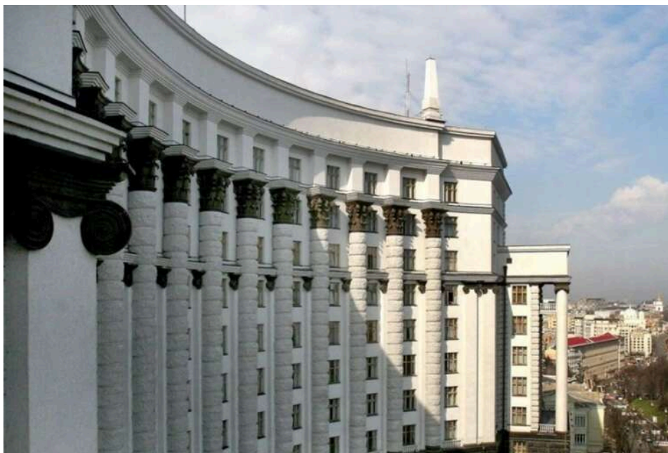
Кабмін вилучив із проекту антикорупційної стратегії вимоги ЄС щодо реформи ДБР та Офісу генпрокурора, – Радіна

Уряд Свириденко вилучив із проекту антикорупційної стратегії кілька ключових вимог Євросоюзу, які передбачали розширення повноважень НАБУ і САП, а також виведення Офісу генпрокурора та ДБР з-під контролю Зеленського.