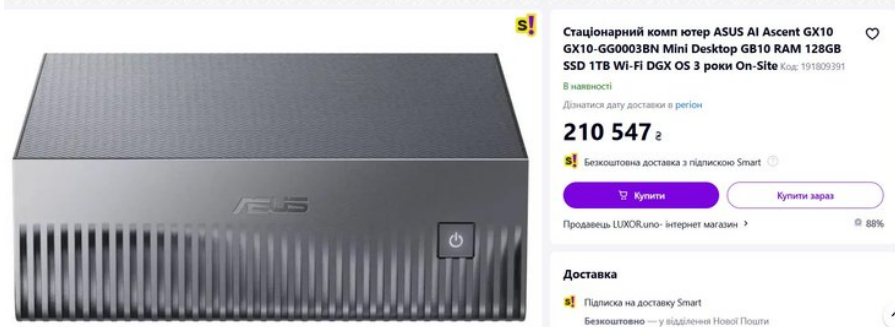
Яка ціна комп'ютера Asus Ascent Gx10

На онлайн-майданчиках інтернет-магазинів можна відшукати комп'ютер, який купила Безугла. Залежно від майданчика, його ціна коливається в межах від 170 до 200 тис. грн.