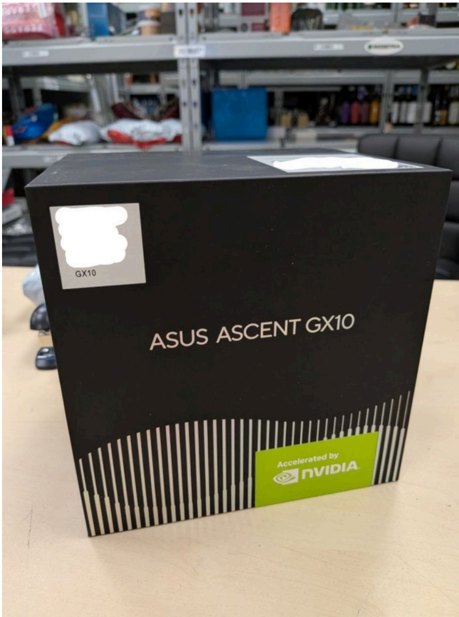
Коробка з комп'ютером Asus Ascent Gx10