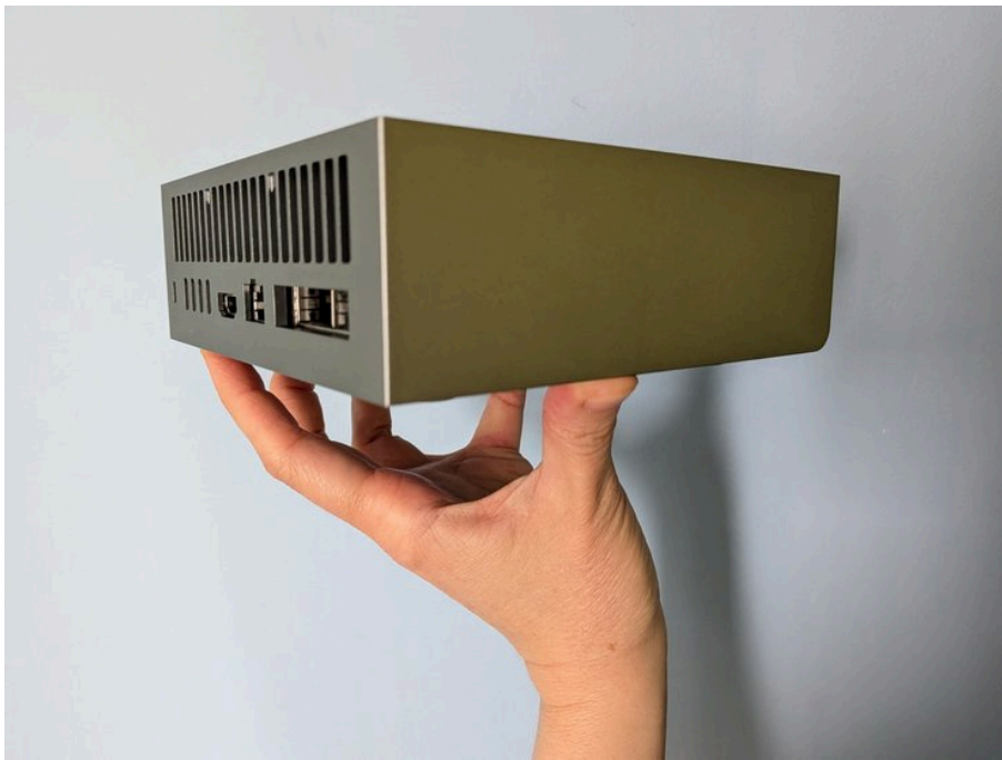
Системний блок комп'ютера Asus Ascent Gx10