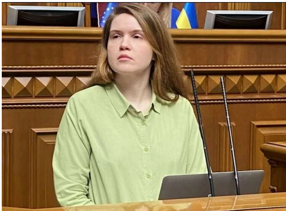
Нардепка Мар'яна Безугла купила за бюджетні кошти комп'ютер зі ШІ за 4000 доларів

В офісі народної депутатки Мар'яни Безуглої з'явився системний блок комп'ютера Asus Ascent Gx10, на якому можна встановити власну модель штучного інтелекту (ШІ). Комп'ютер отримав назву «Афіна», коштує 4 тис. дол. і локально оброблятиме тисячі сторінок документів, написала політикиня. Безугла заповнила, що задекларує майно, яке купила за гроші платників податків для власного офісу.