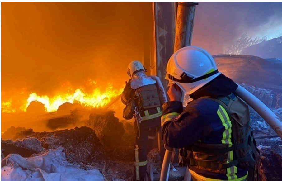
Фото: ДСНС (ілюстративне фото) Росіяни атакували Кривий Ріг безпілотниками

Внаслідок шахедної атаки в Центрально-Міському районі міста одна жінка отримала поранення.