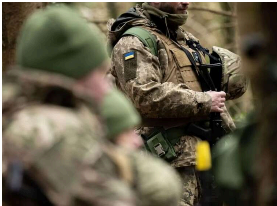
Втрати ворога: ЗСУ за добу ліквідували ще 1140 окупантів та 78 артсистем

Протягом доби, 18 травня, українські захисники ліквідували та поранили ще 1140 російських окупантів. Крім того, на полі бою було знищено десятки одиниць різної ворожої техніки.