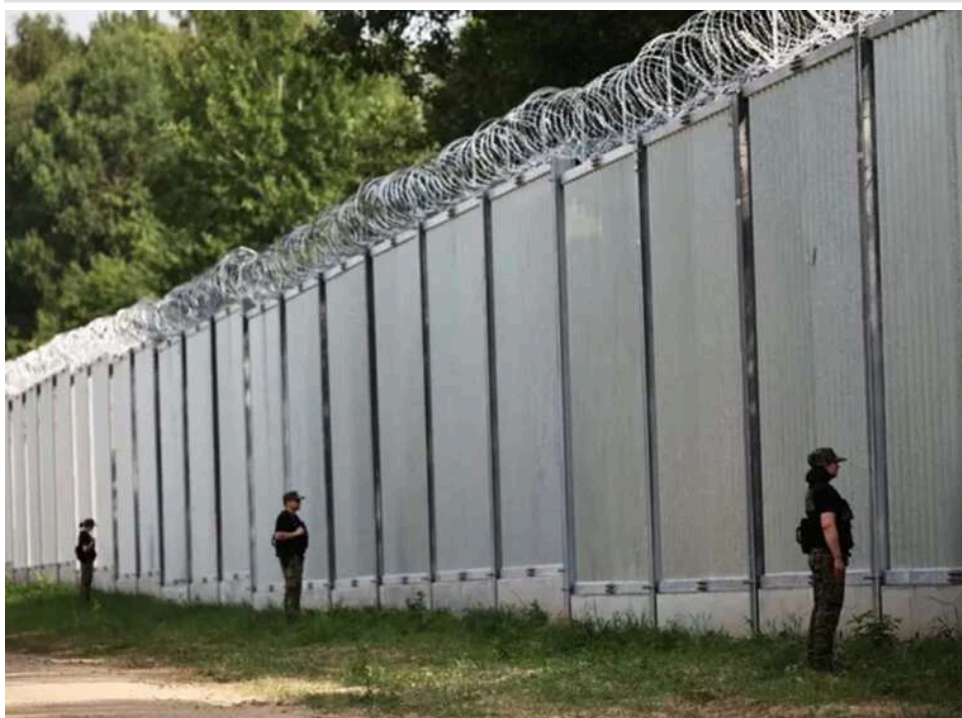
У Білорусі запровадили обмеження на відвідування лісів у прикордонних районах

Влада Білорусі офіційно запровадила обмеження на відвідування лісів у 19 районах країни.