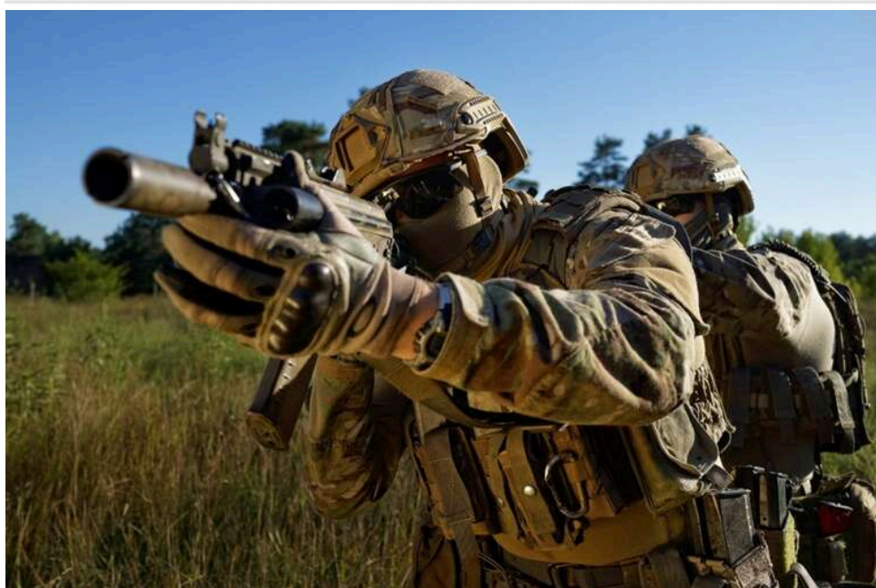
Ситуація на фронті: понад 200 бойових зіткнень за добу, Росія застосувала ракети, авіабомби та понад 6 тисяч дронів-камікадзе

Від початку доби 18 травня на фронті сталося 203 бойові зіткнення.