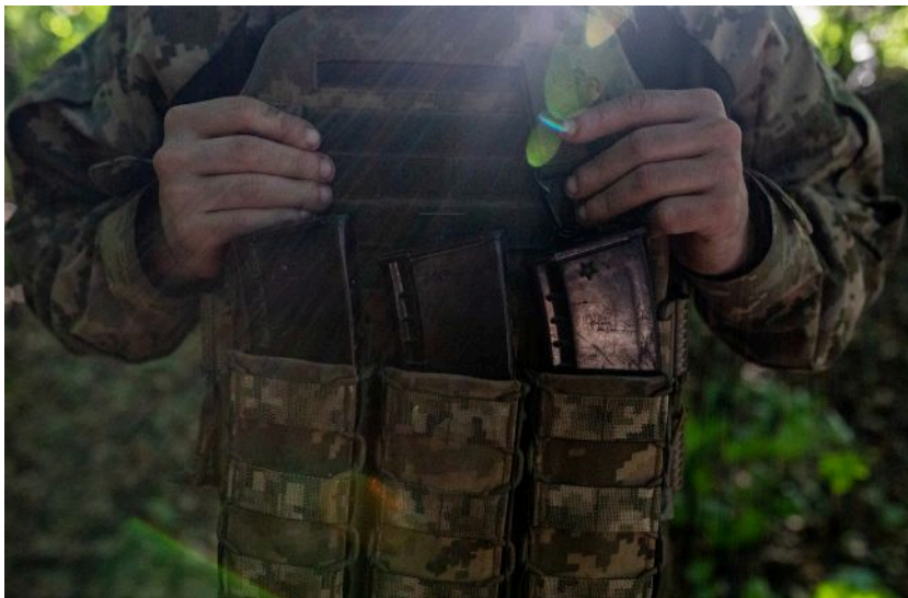
Журналісти спростували інформацію про так звані "бронезилети Міндіча"