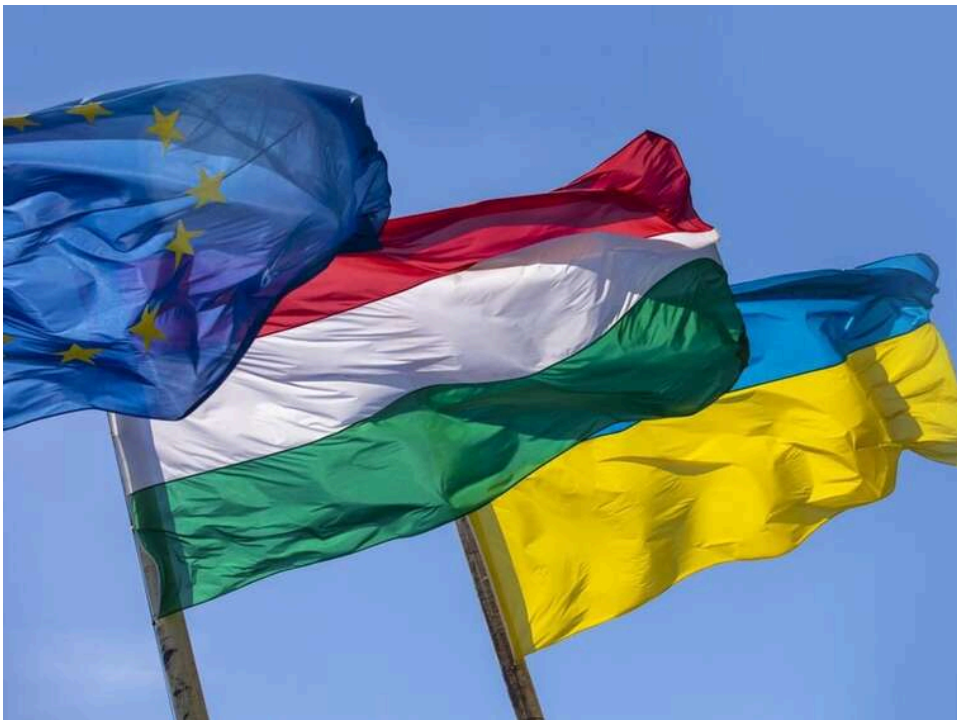
Угорщина висунула Україні нові умови для початку переговорів про вступ до ЄС

Угорський прем'єр Мадяр заявив, що Україна зможе розпочати процес вступу в ЄС лише після виконання всіх 11 вимог Будапешта, що стосуються прав угорців Закарпаття.