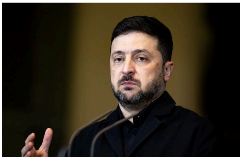
Фото: Володимир Зеленський (GettyImages)