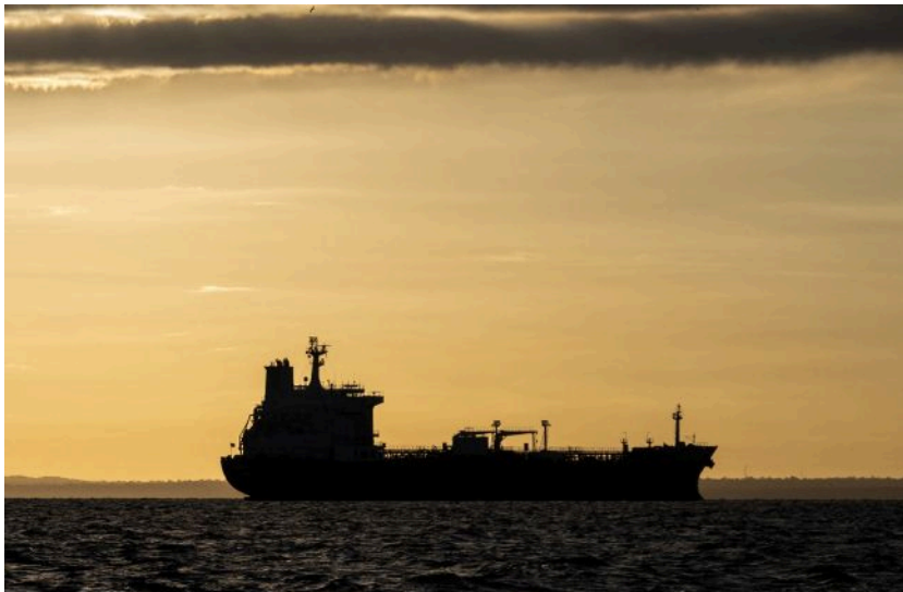
Фото: Росія розширює тіньовий флот для експорту зрідженого газу (Getty Images)