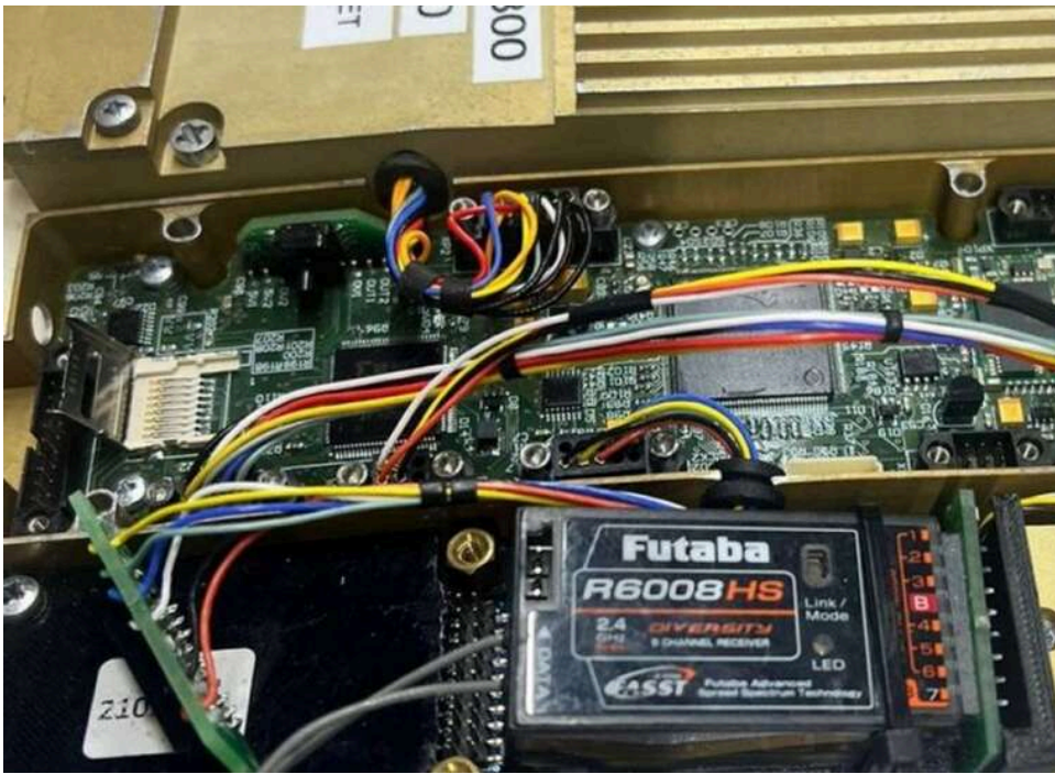
Поставки в обхід санкцій: у Німеччині затримали бізнесмена за експорт європейських технологій для ВПК Росії