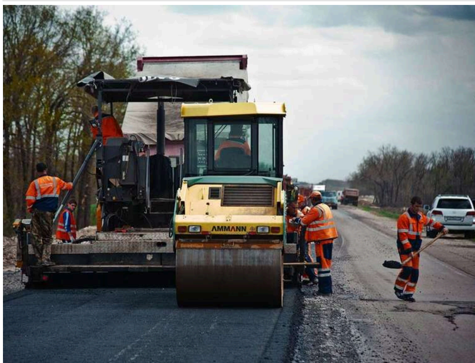
«Ренесанс» без грошей: як дорожній картель розбирає мільярдні тендери у Прозорро за «нульового» фінансування

З 10 по 15 травня у системі «Прозорро» оприлюднено 69 тис. повідомлень про закупівлі на 30,86 млрд грн