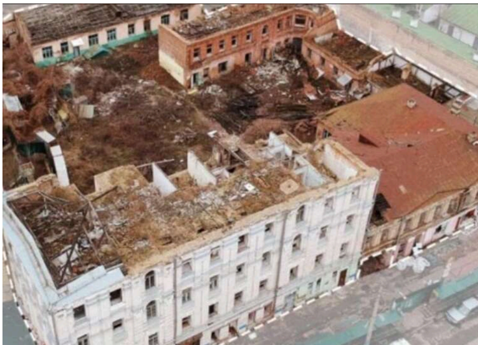
«Дахи обвалилися самі»: у суді забудовник садиби Дмитрієва заперечує навмисне руйнування пам'яток на Подолі