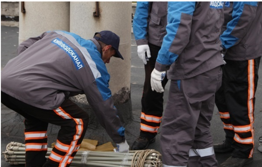
Во всех районах столицы восстановили водоснабжение

На левом берегу столицы водоснабжение восстановлено в полном объеме. А на правом – давление в водопроводных сетях постепенно восстанавливается.