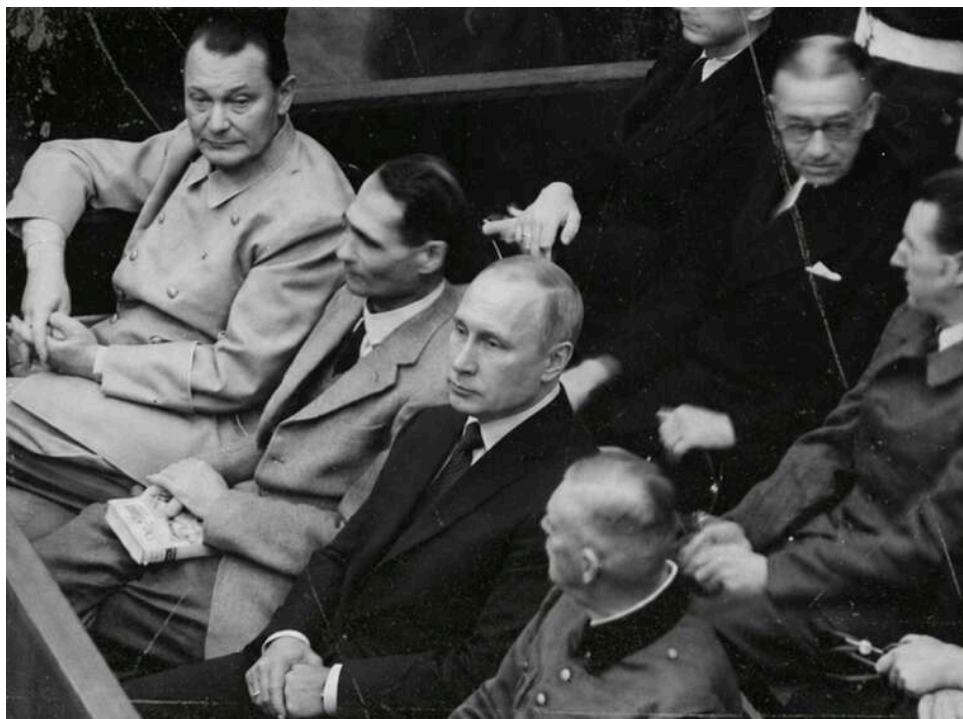
«Нюрнберг» для Кремля: 25 країн уже підтримали Спецтрибунал щодо злочину агресії проти України

Для започаткування багатостороннього механізму трибуналу потрібно було мінімум 16 держав-членів Ради Європи. Станом на початок травня ми маємо вже 25 підтверджень.