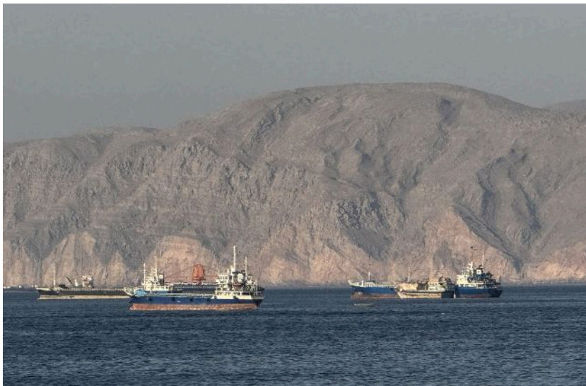
Фото: Війна в Ірані коштувала глобальному бізнесу вже 25 млрд доларів (Getty Images)