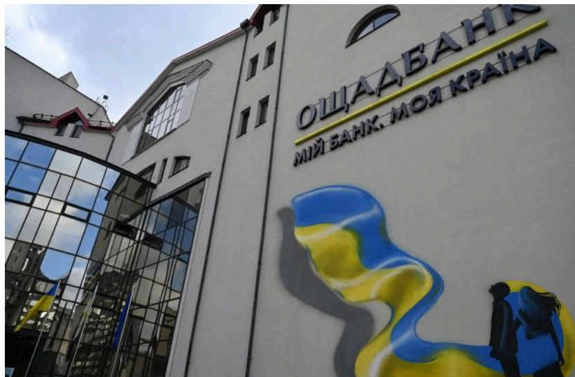
Фото: Ощадбанк домогся скасування рішення Угорщини для сімох інкасаторів (Getty Images)