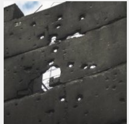
Як виглядає українська ТЕЦ, що пережила не одну ракетну атаку російських загарбників