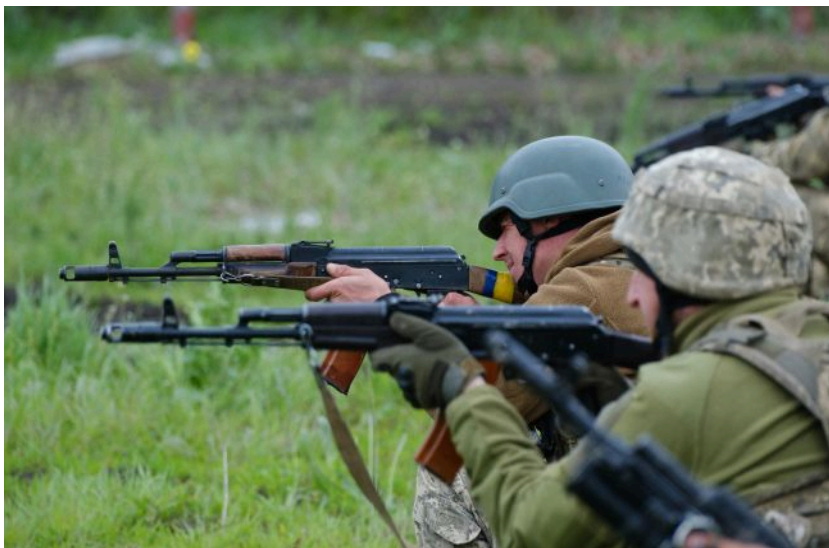
Військові можуть повернутися в свою бригаду після СЗЧ