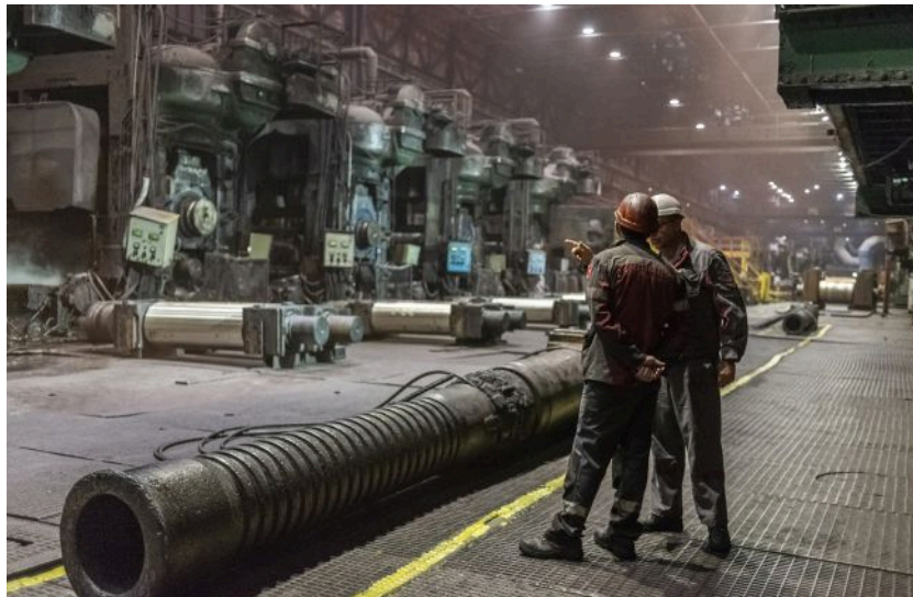
Україна може втратити понад 1 мільярд євро експорту