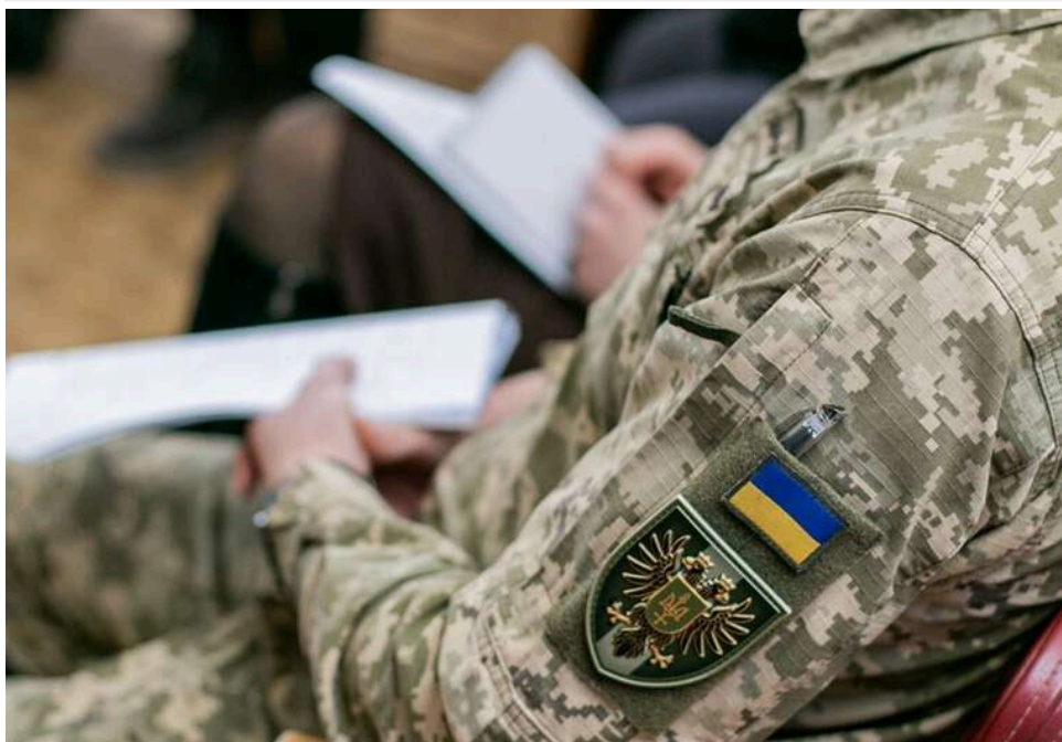
Зламали замок та зайшли без дозволу: на Хмельниччині заявляють про самовільне проникнення ТЦК до приватного будинку

ТЦК почали виламувати двері та вриватися до осель: на Хмельниччині заявляють про проникнення до будинку без господарів.