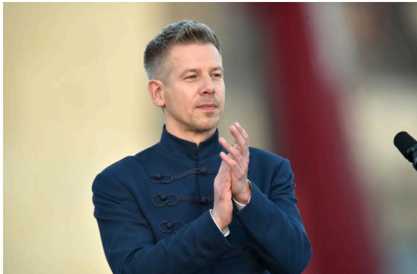
Фото: Угорщина заявила про старт переговорів з Україною