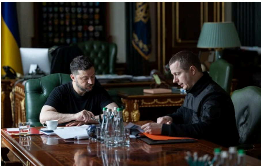
Володимир Зеленський заслухав доповідь Олега Луговського

Москва намагається приховати реальні дані про ситуацію в економіці як від міжнародної спільноти, так і від власного населення.