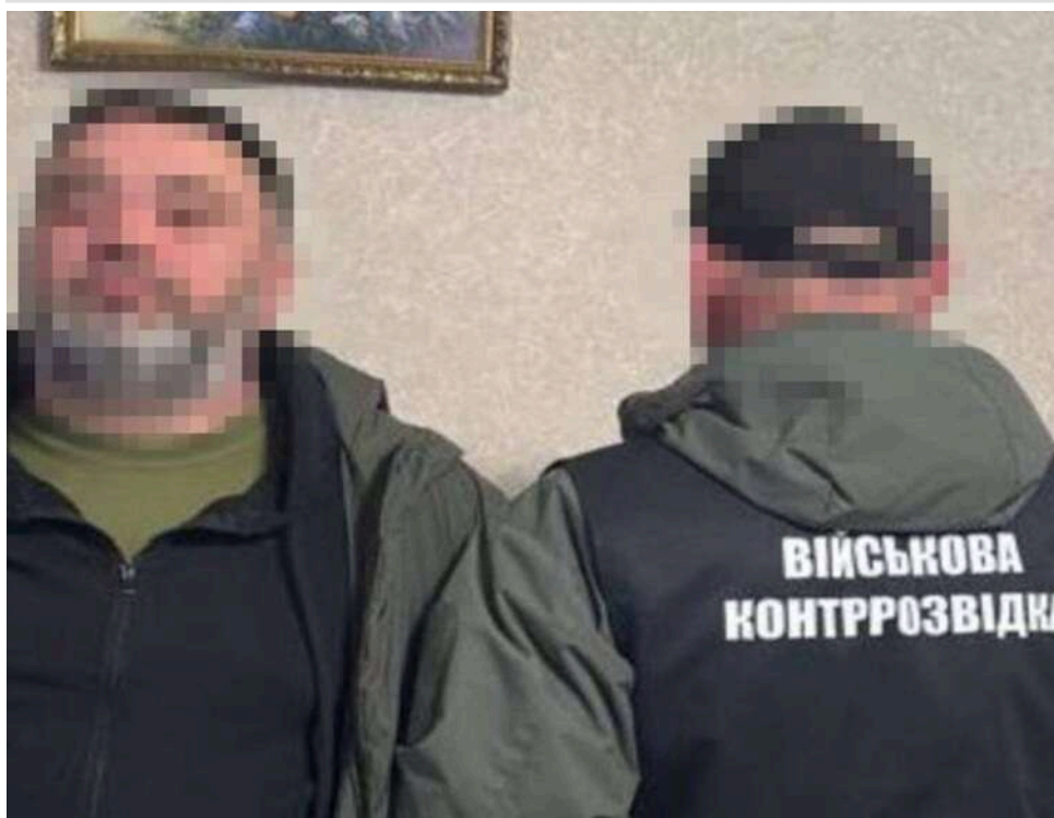
СБУ, ДБР і Нацполіція викрили чотири нові схеми ухилення від мобілізації: серед затриманих – командири частин

Військова контррозвідка Служби безпеки, ДБР та Національна поліція викрили чотири нові схеми ухилення від військової служби та мобілізації.