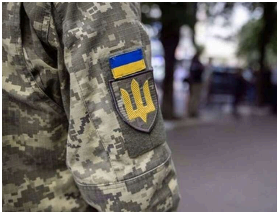
Скандал на Житомирщині: 24-річного лікаря-інтерна мобілізували одразу після настання 25-річчя в стінах ТЦК

У Житомирській області 24-річного лікаря-інтерна мобілізували після візиту до ТЦК для оновлення даних.