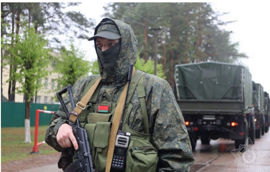
У Білорусі розпочали ядерні навчання з РФ