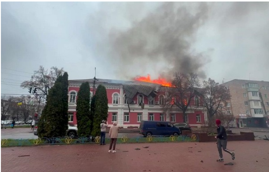
Пожежа у будівлі міськради Прилук внаслідок удару "шахеда" 7 квітня

Також ворожий дрон атакував будівлю Державної податкової інспекції у центрі міста Новгород-Сіверський.