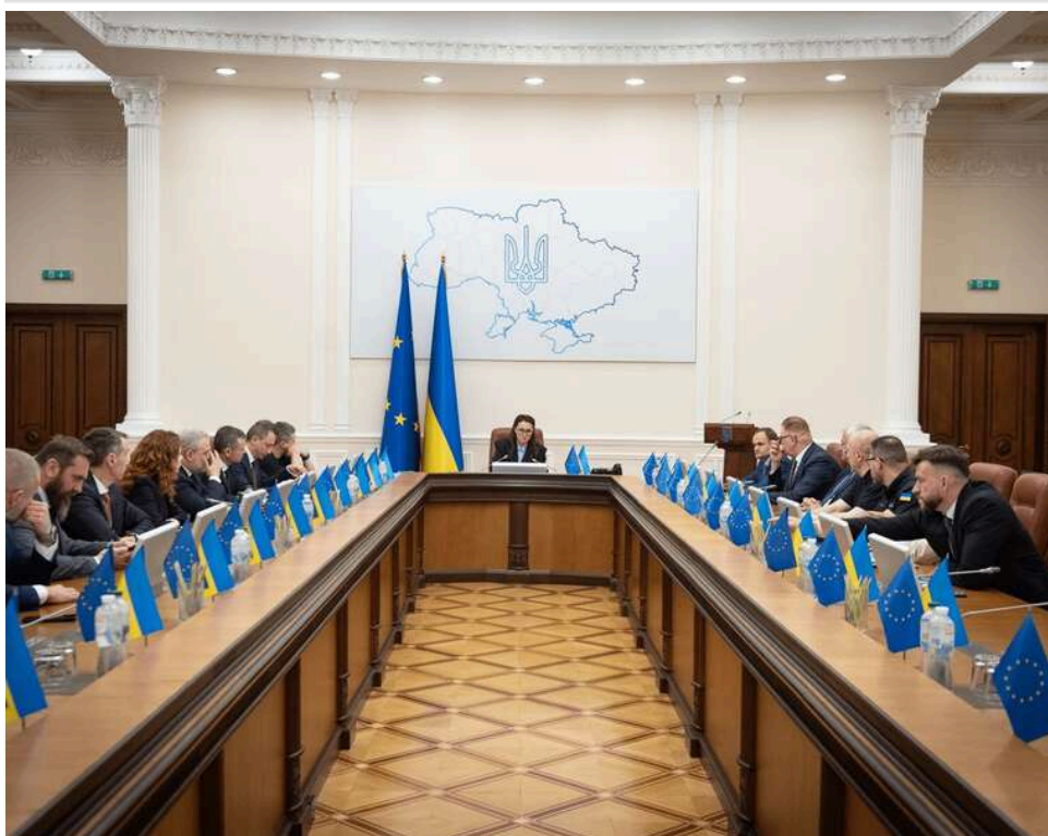
Кабмін викинув ключові реформи з антикорупційної стратегії: Радіна заявила про зрив євроінтеграційних обіцянок

Кабінет Міністрів подав свій проєкт антикорупційної стратегії, з якого вилучили найважливіші реформи. Уряд Свириденко фактично проігнорував ключові євроінтеграційні зобов'язання, які Україна взяла на себе в комюніке Качки-Кос.