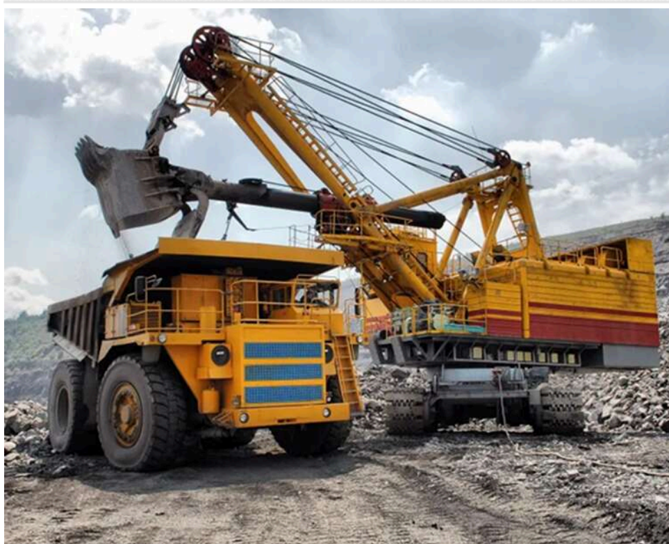
Справа «Інком Техніка»: СБУ викрила канал експорту українського обладнання на російські шахти