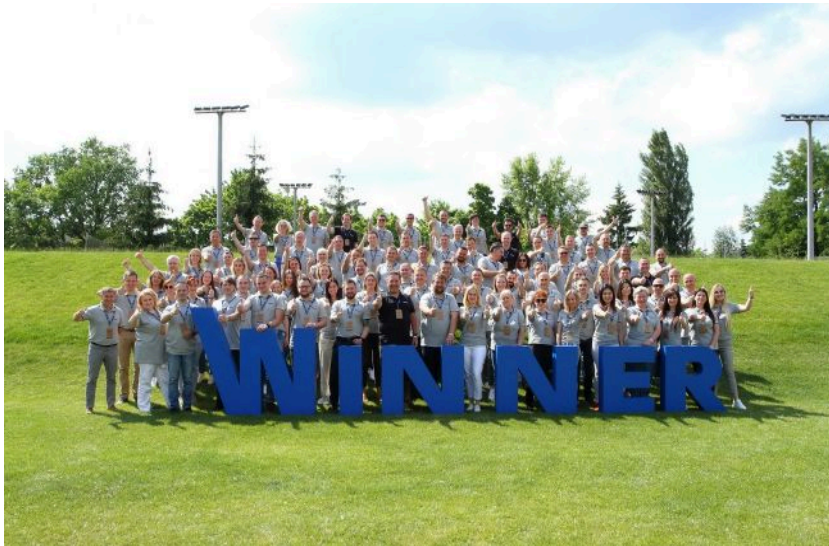
Winner у топі кращих роботодавців України