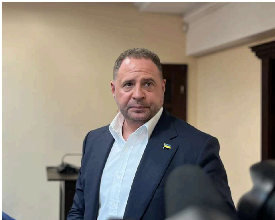
Хто вніс 140 мільйонів застави за Єрмака: список фізосіб та компаній

На заставу для колишнього голови Офісу президента Андрія Єрмака кошти внесли 7 фізичних і 7 юридичних осіб.