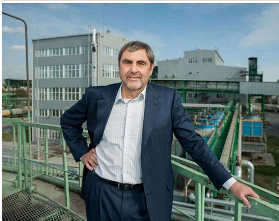
«Магія» Печерського суду: як власник ViOil Пономарчук знімає арешти з активів попри «російський слід»

Російський слід, кіпрський паспорт і «магія» Печерського суду: як Віктор Пономарчук повертає активи ViOil.