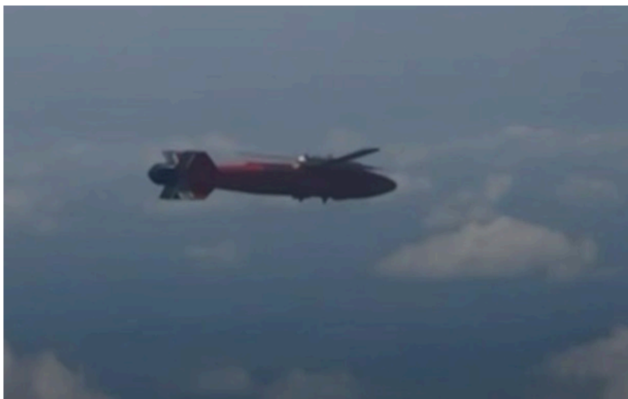
Український КАБ прямує до цілі

Ця бомба з бойовою частиною у 250 кг не є копією західних чи радянських рішень, а власною розробкою українських інженерів, запевнив Михайло Федоров.