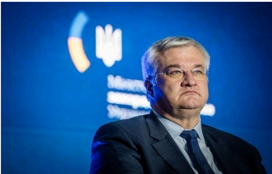
Андрій Сибіга повідомив про заплановані консультації з Угорщиною

Глави МЗС домовилися провести раунд угорсько-українських консультацій на рівні експертів вже цього тижня.