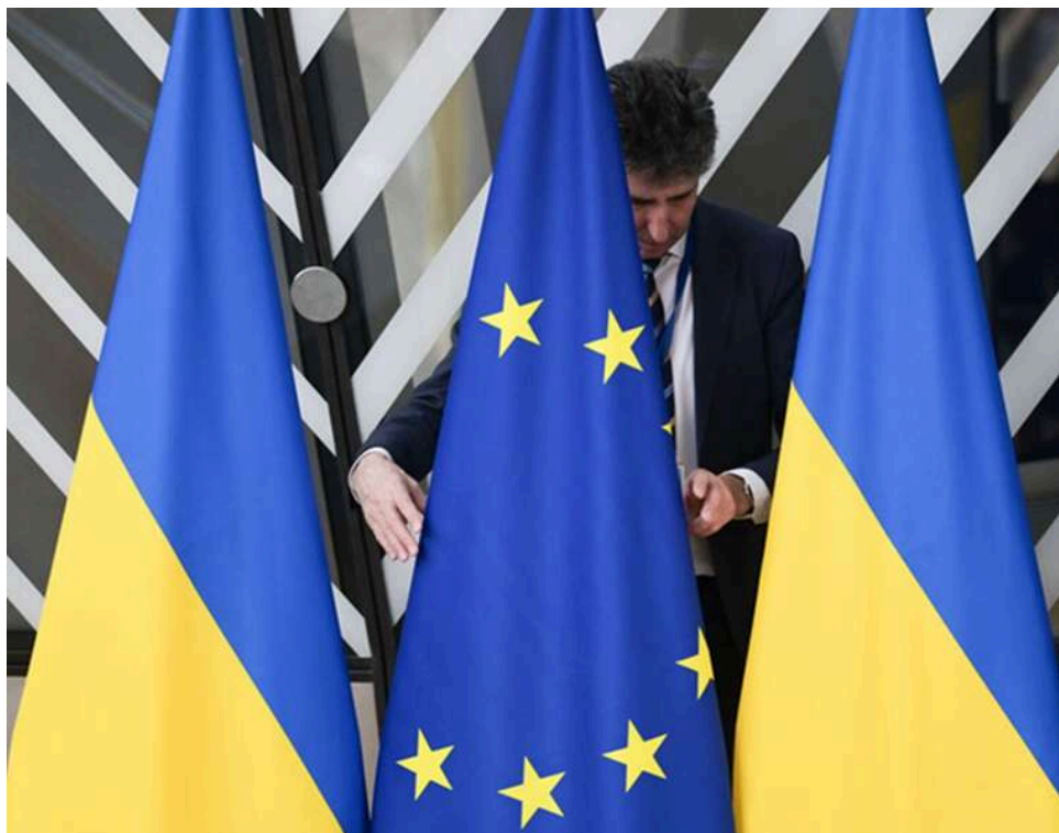
У ЄС шукають спецпосланця для переговорів: які шанси у Меркель та чому Брюссель відкинув кандидатуру Шрьодера

Як можливого спецпосланника Європи для переговорів про мир між Україною та Росією розглядають колишнього канцлера Німеччини Ангелу Меркель, президента Фінляндії Александра Стубба та експрем'єра Італії Маріо Драгі, повідомляє Politico з посиланням на свої джерела.