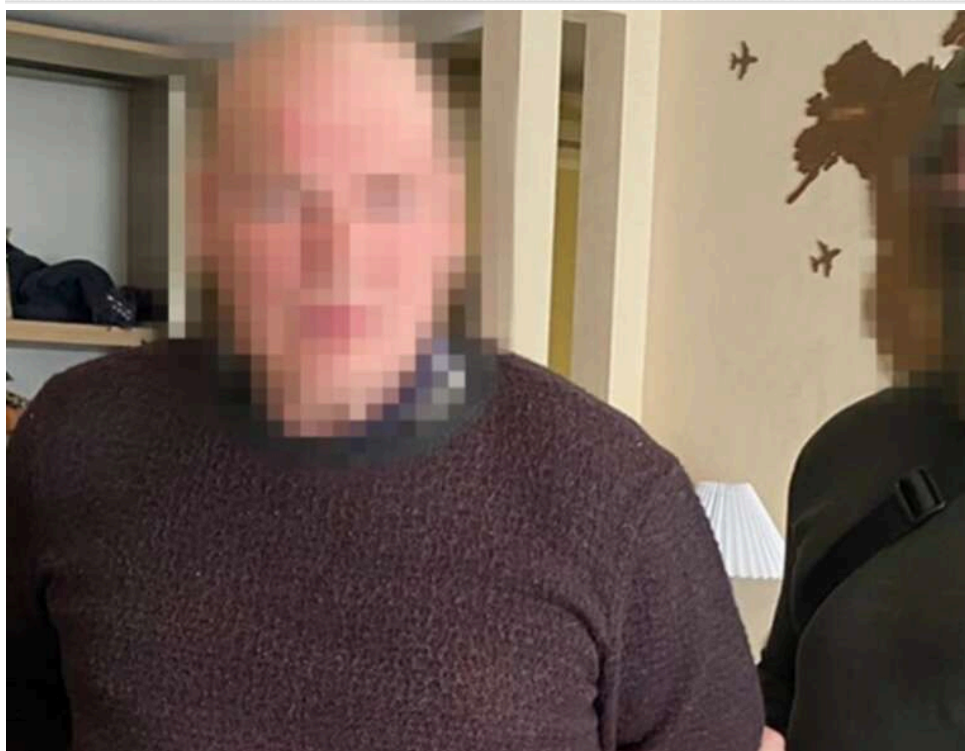
СБУ затримала у Нікополі агента ФСБ: рецидивіст наводив «Гради» та дрони на позиції ППО